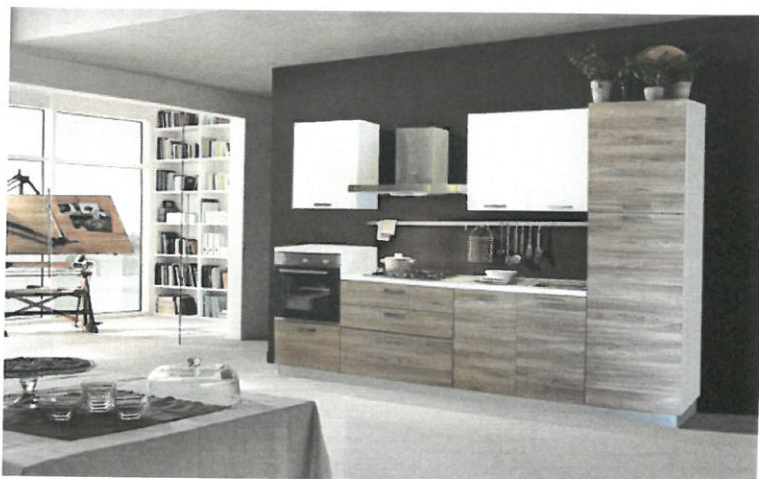
Foto della cucina messa in palio come primo premio del concorso.

Caratteristiche della cucina: Cucina Miss Cucine completa di elettrodomestici (esclusi accessori) in finitura rovere bianco, misura L 300 cm H 214 cm P 60 cm, composta da colonna da 60 cm per frigo, colonna da 60 cm per forno, base da 90 cm con 2 cassetti e un cesto per piano cottura, base 90 cm, 2 ante per lavello, lavello da 90 cm, 1 vasca più gocciolatoio, cappa inox da 90 cm, pensile scolapiatti da 90 cm 2 ante, pensile da 60 cm 1 anta, top laminato h 4 cm, zoccolo finitura alluminio, frigo freezer da 230 litri, piano cottura inox 4 fuochi, forno elettrico statico.